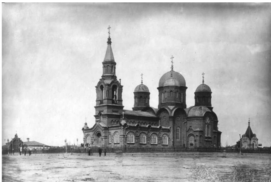
Свято-Преображенский собор Юзовки