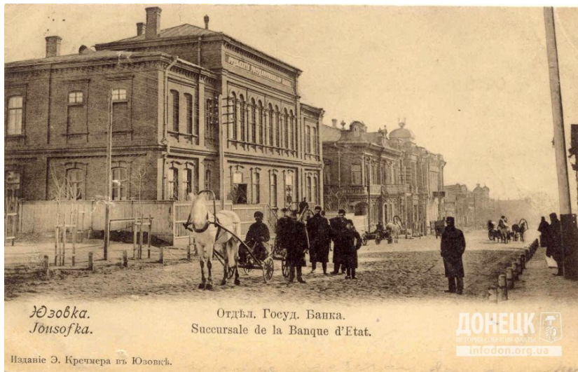
Юзовское отделение Государственного банка