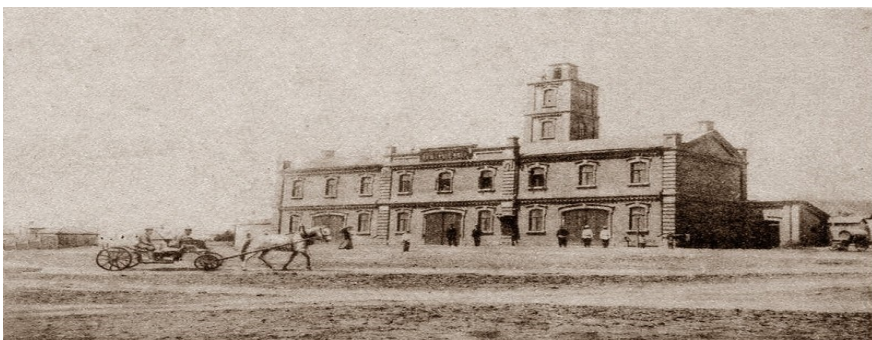
(прил_6 в ПЭ)

В верхней части здания пожарной части, мы видим пожарную вышку – каланчу. Давайте поднимемся на неё и посмотрим на Юзовку с севера на юг (в сторону металлургического завода).