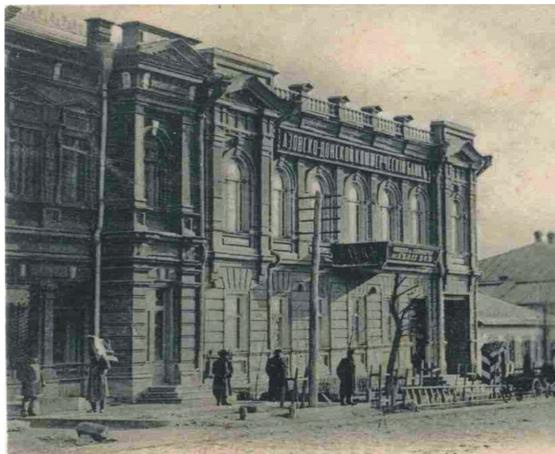
Юзовское отделение Азовско-Донского коммерческого банка