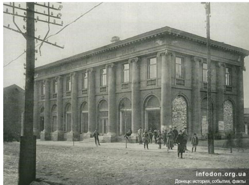
Петербургский коммерческий банк