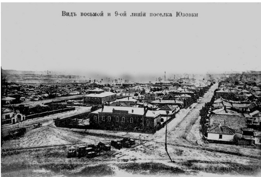
(прил_7 в ПЭ)

Вот этот вид, который можно датировать 1904 годом: