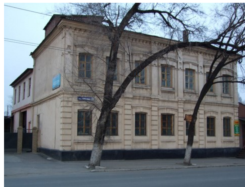
Здание до реконструкции