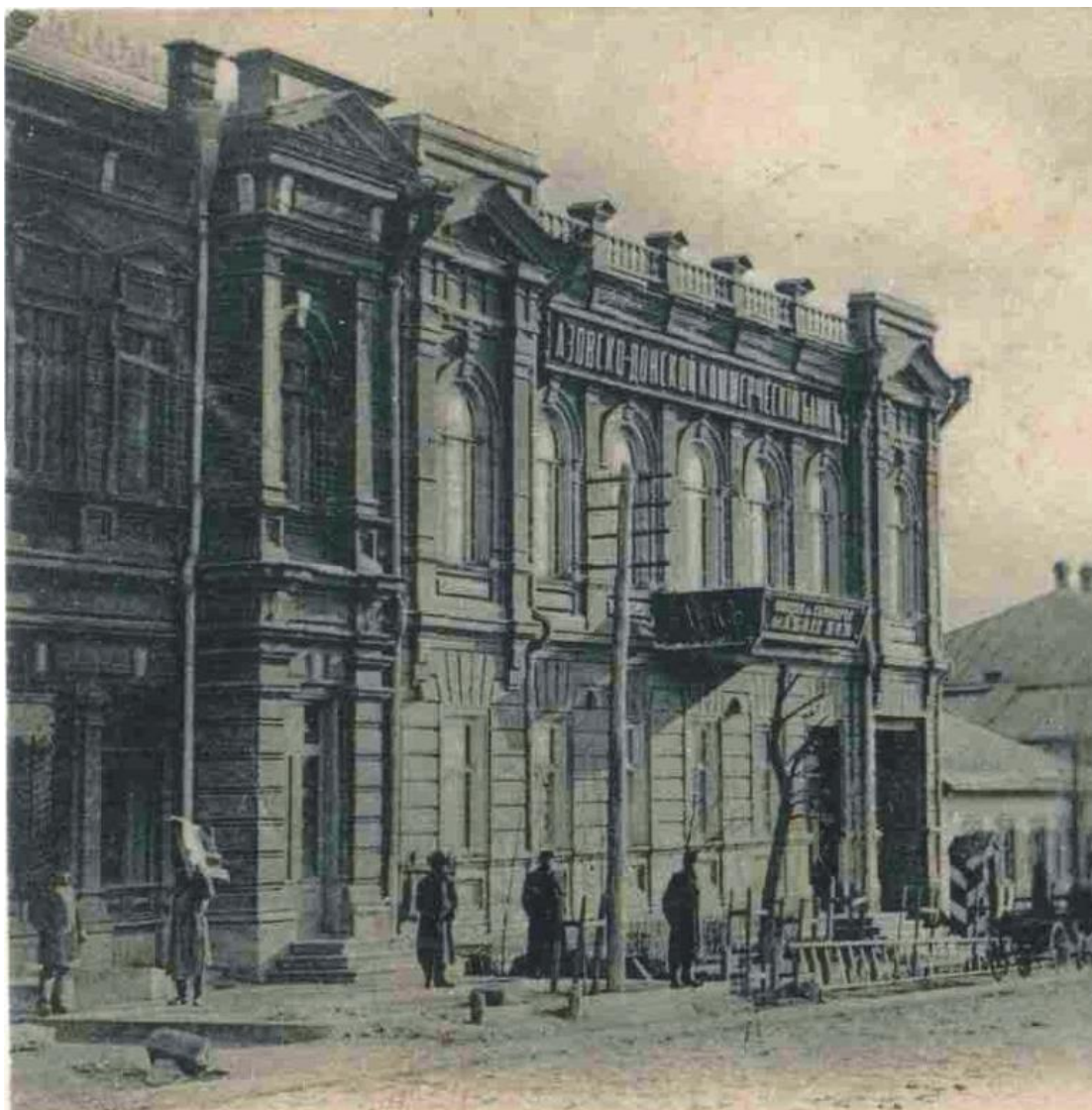
Юзовское отделение Азовско-Донского коммерческого банка