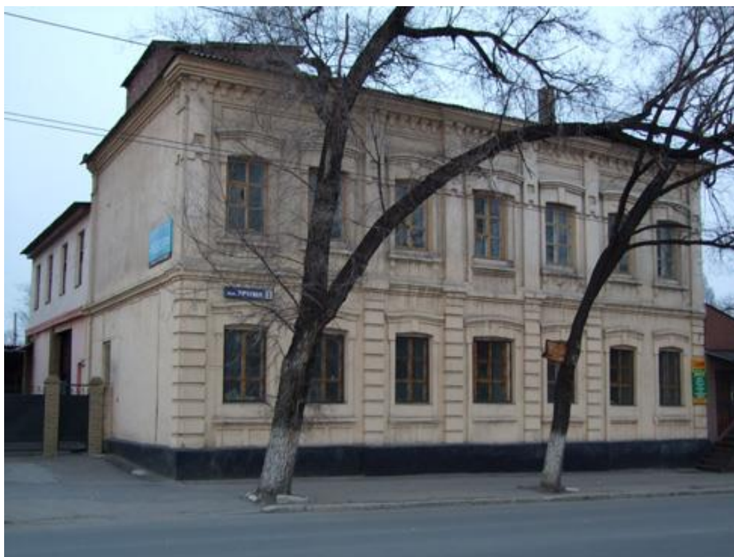
Здание до реконструкции