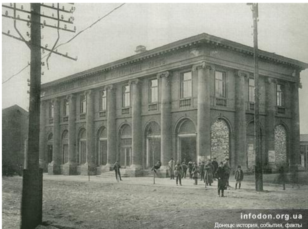
Петербургский коммерческий банк