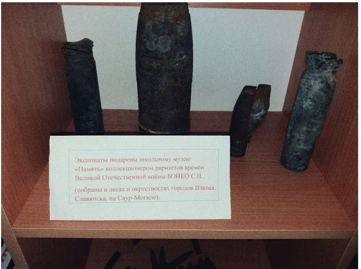
Музейные экспонаты (гильзы, пулеметные ленты) времен Великой Отечественной войны