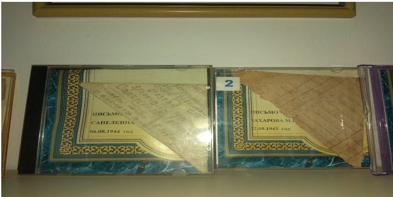
Письма с фронта. Письмо Сапелкина 1944г., письмо Захарова 1943г.