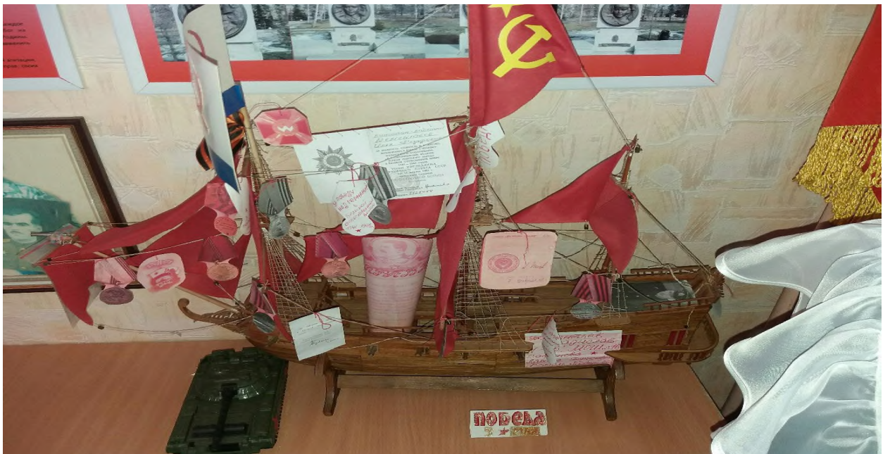
Корабль Победы. Собран учеником 2-Б класса. 2015 год