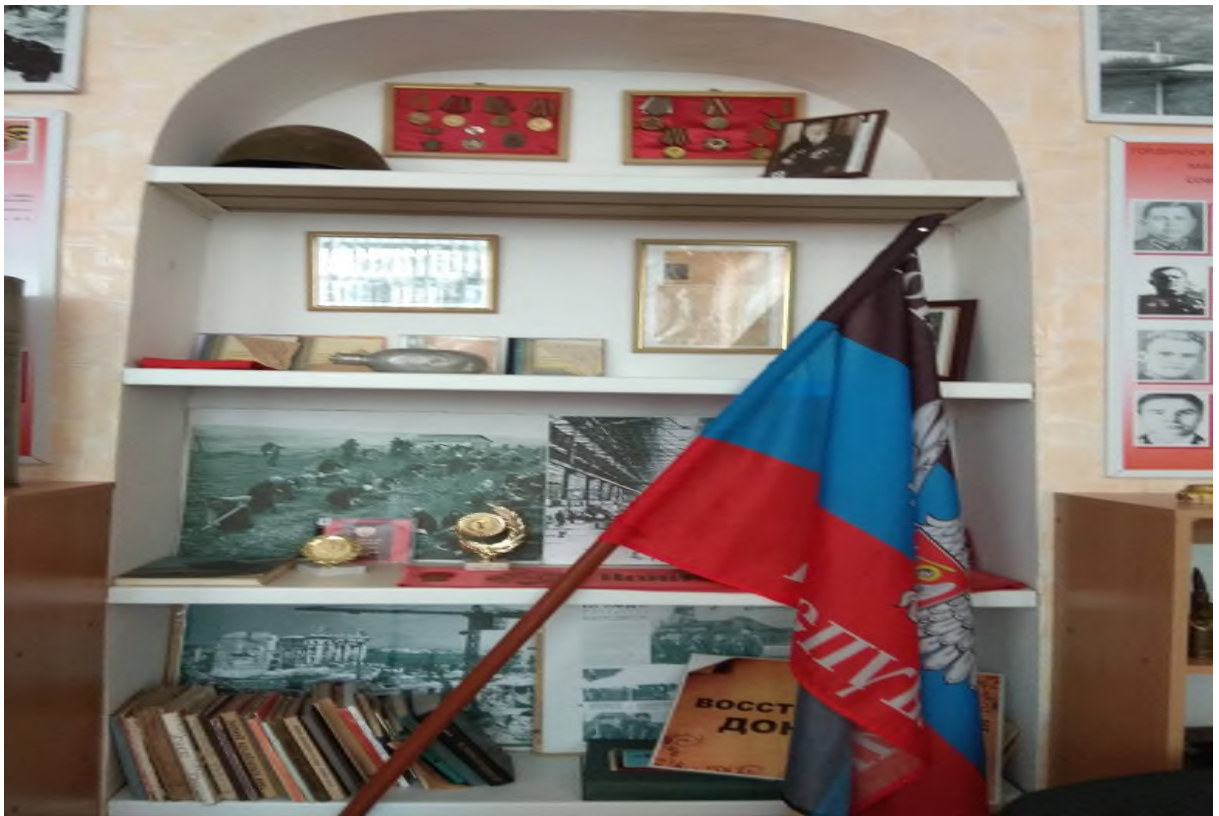
Арочная часть экспозиции « И помнит мир спасенный... »