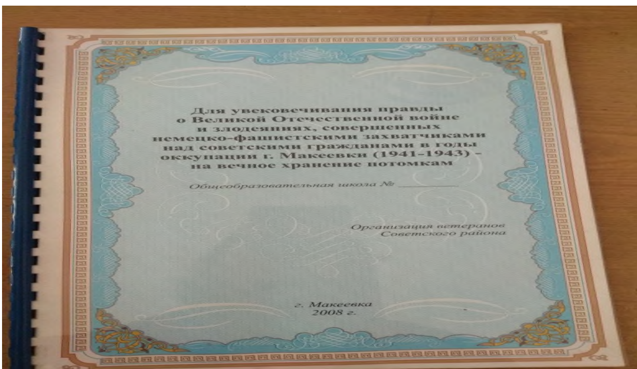
Материалы « Для увековечивания правды о Великой Отечественной войне...» 2008г.