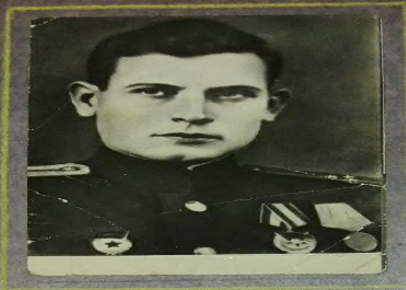
ТУРКЕНИЧ ИВАН ВАСИЛЬЕВИЧ (1920-1944)

КОМАНДИР ПОДПОЛЬНОЙ КОМСОМОЛЬСКОЙ ОРГАНИЗАЦИИ «МОЛОДАЯ ГВАРДИЯ»