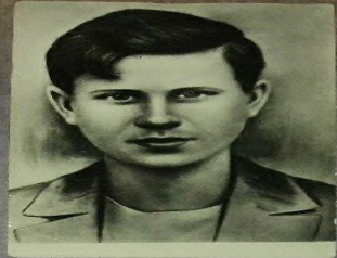
ТЮЛЕНИН СЕРГЕЙ ГАВРИЛОВИЧ (1925-1943)

ГЕРОЙ СОВЕТСКОГО СОЮЗА, ЧЛЕН ШТАБА ПОДПОЛЬНОЙ КОМСОМОЛЬСКОЙ ОРГАНИЗАЦИИ «МОЛОДАЯ ГВАРДИЯ»