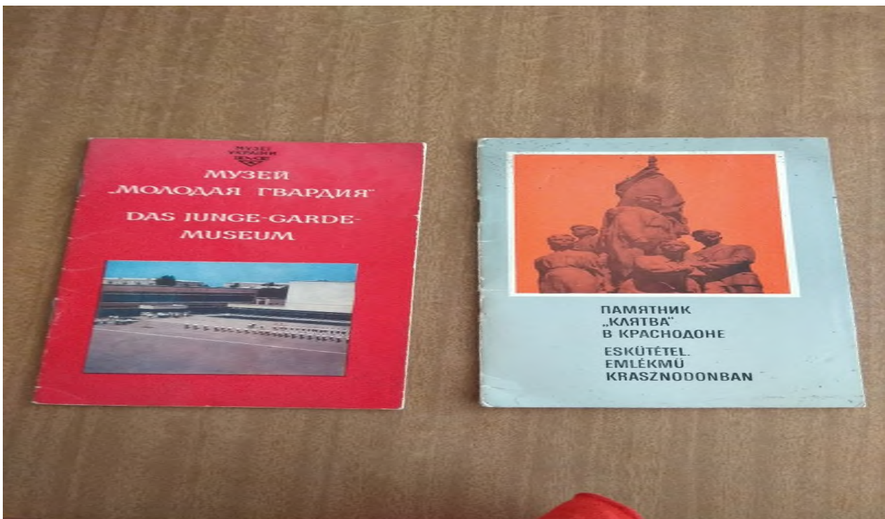
Проспект тематической экскурсии музея « Молодая гвардия» 1983года