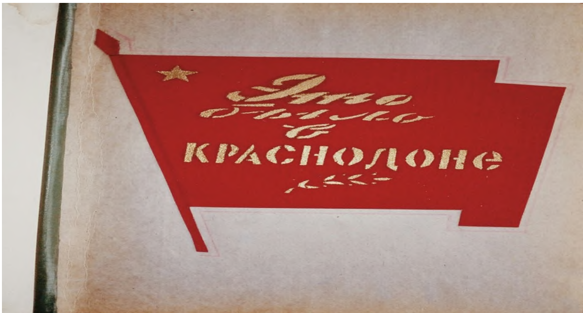
Исторические материалы альбома « Это было в Краснодаре»