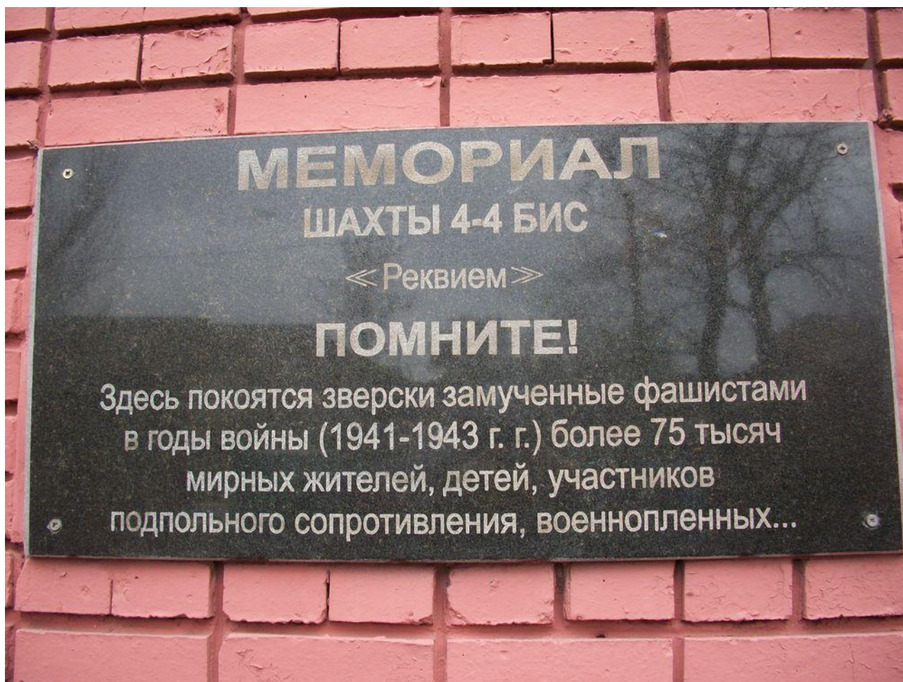
«Мемориал Шахты 4-4 бис»