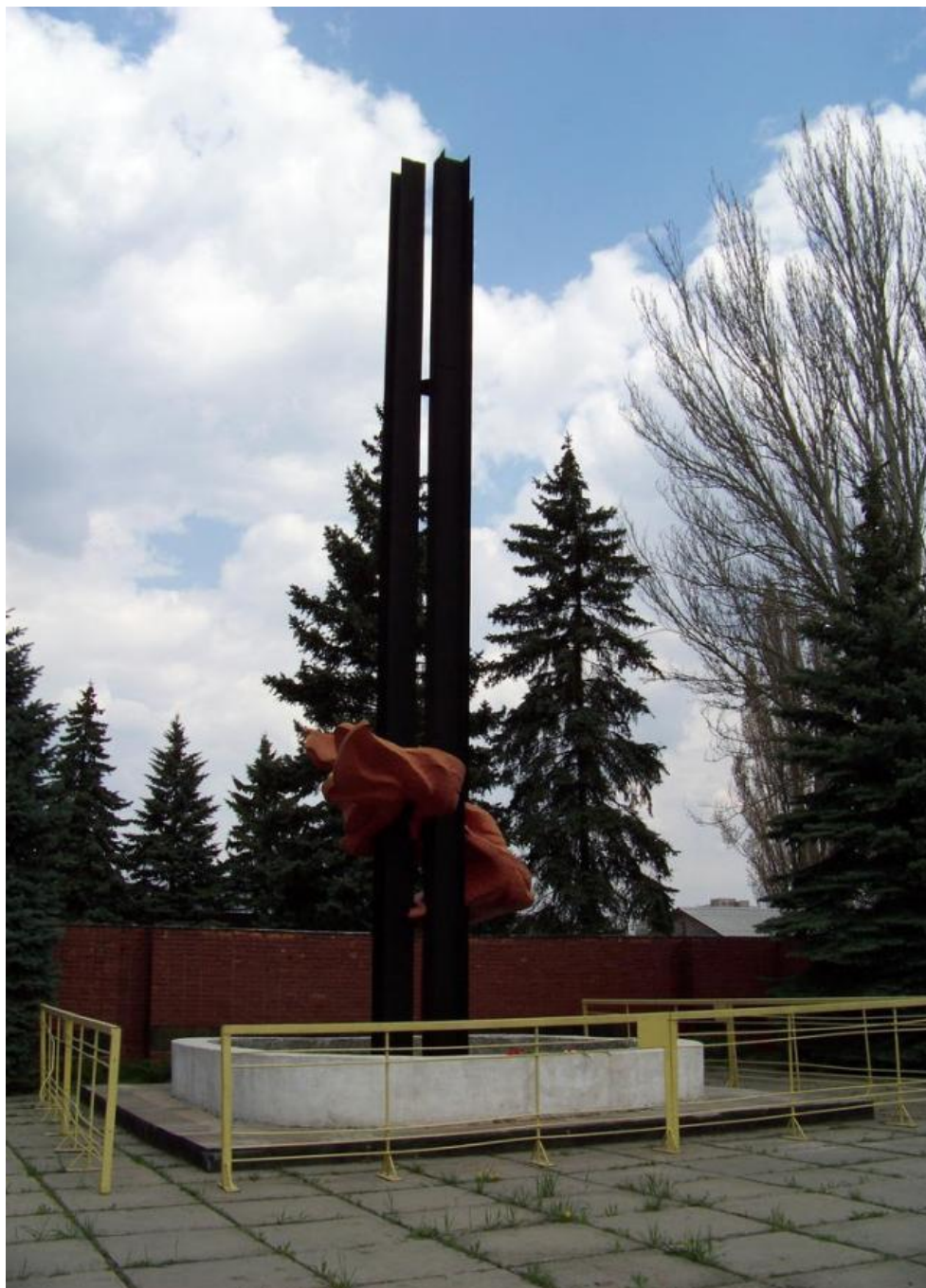
Мемориал у шурфа шахты № 4-4-бис