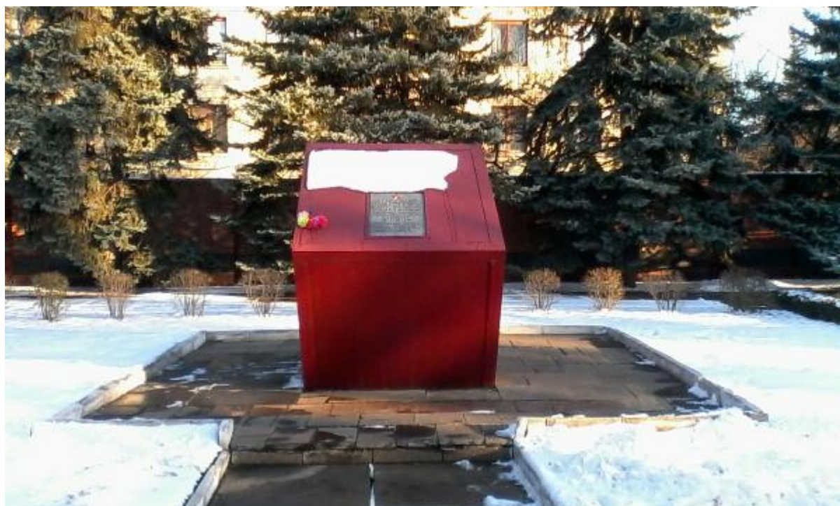
Здесь покоится прах зверски замученных и сброшенных в шурф шахты 4/4 «бис» мирных жителей, участников донецкого подполья, военнопленных солдат и офицеров.