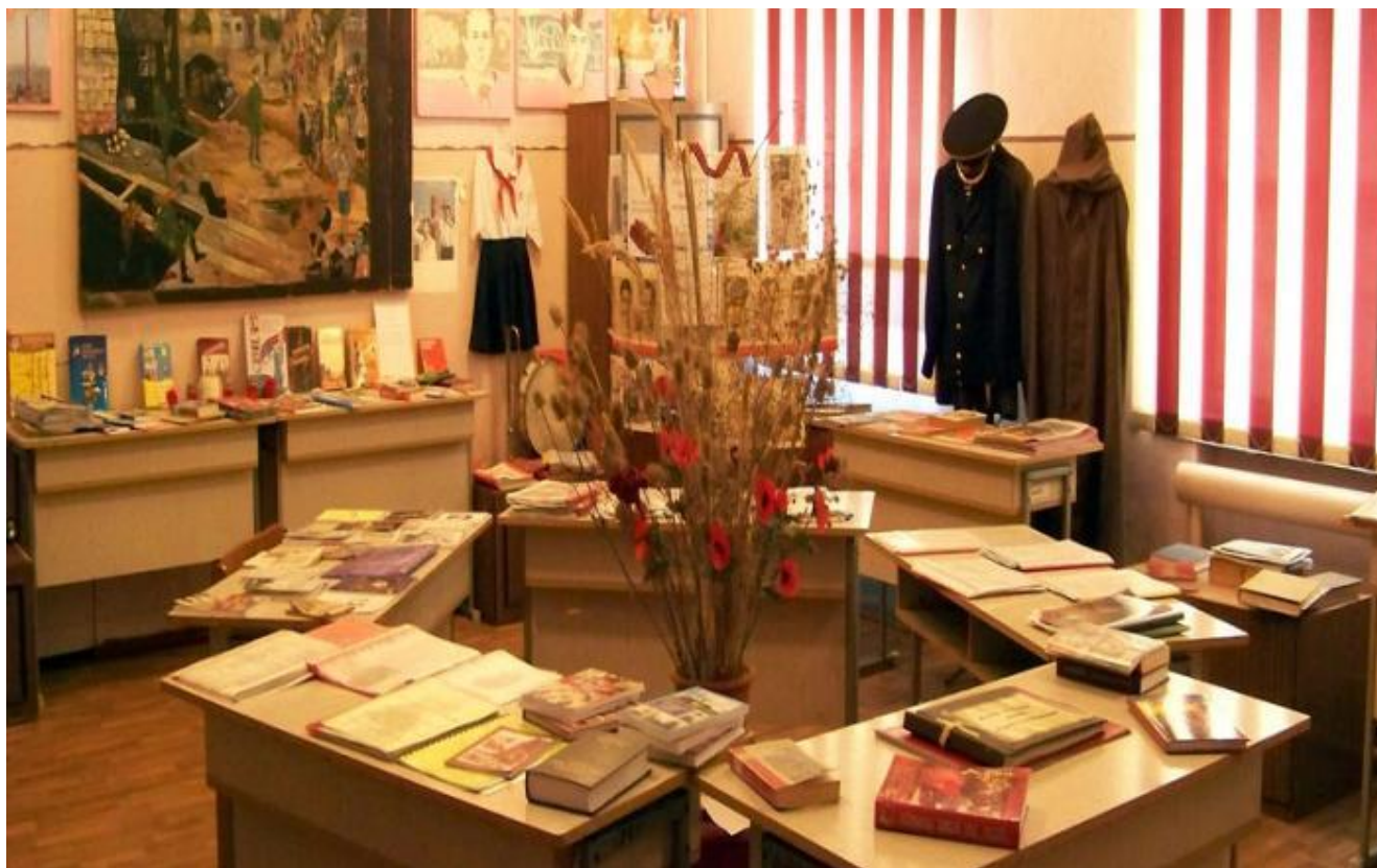
Музей МОУ «Школа № 8 им.А.В.Гавришенко г.Донецка»