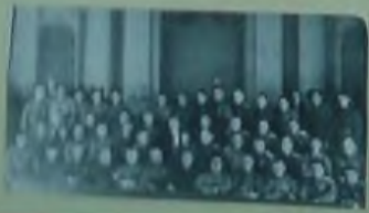
Участники обороны Москвы, 1941-1942 гг.

С первых дней войны прозвучали слова: «Вставай, страна огромная, вставай на смертный бой!»