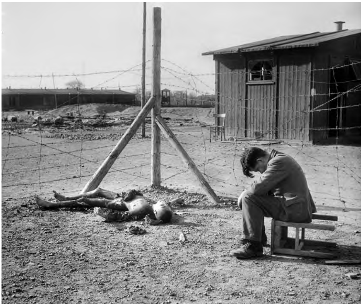
Голодные заключенные, почти умершие от голода, в концлагере в Эбензее, Австрия, 7 мая 1945 год