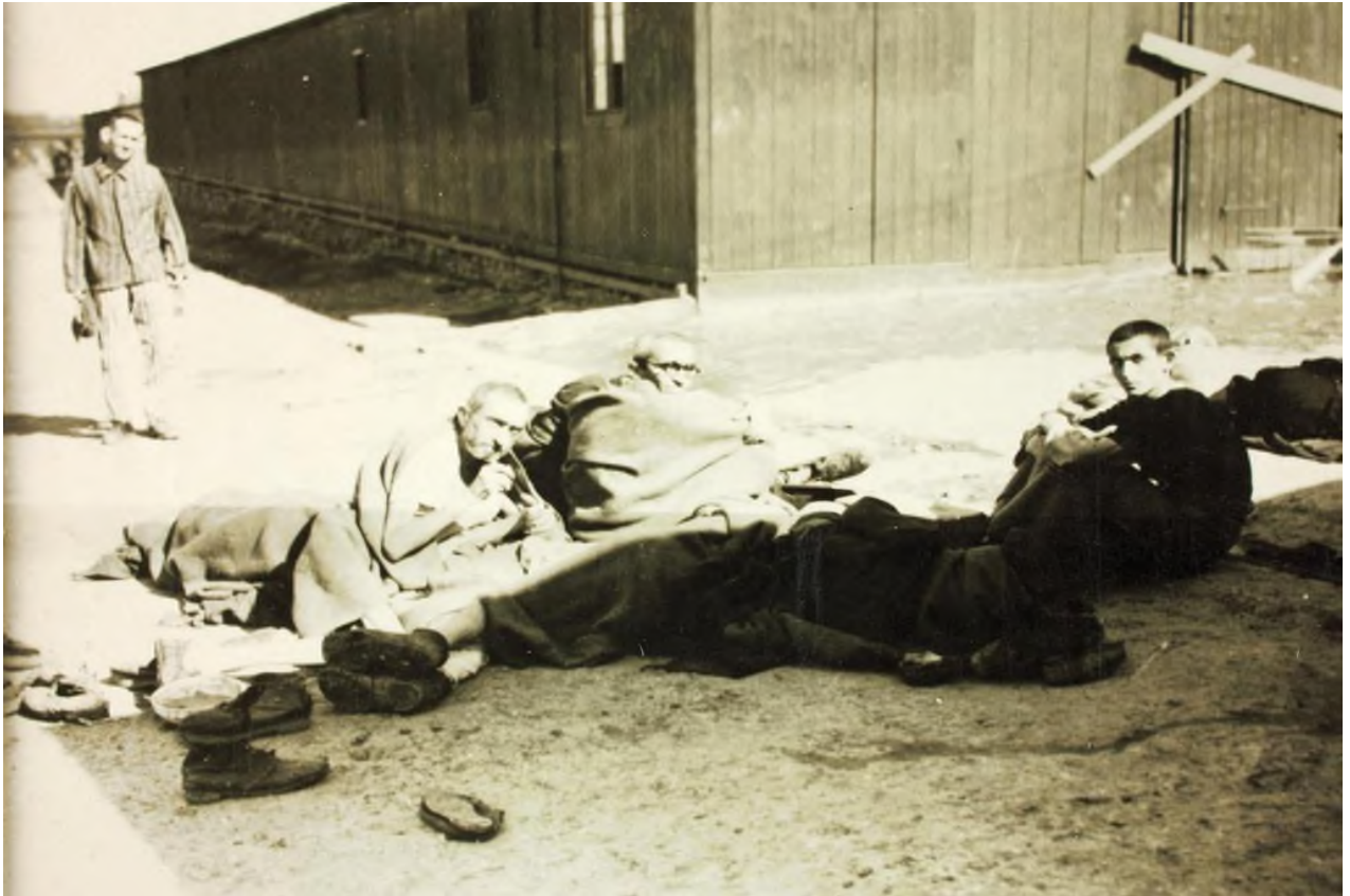
В концентрационном лагере «Треблінка» (с персоналом 150 человек) было убито более 870 000 евреев.