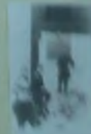
Резников Александр Иванович, лейтенант Советской Армии, участник обороны Москвы, погиб 14 февраля 1942 г. в деревне Желтово.