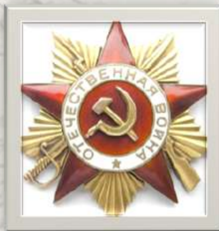
орденом Отечественной войны 1-й степени