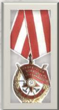
орденом Красного Знамени