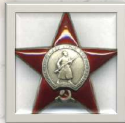
орденом Красной Звезды